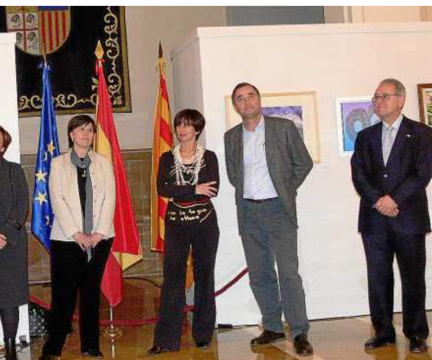
con el respaldo de las autoridades. En la imagen, representación institucional del pasado año.