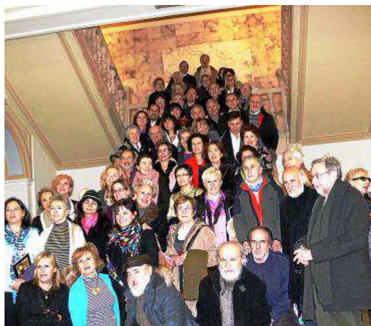
Todos los artistas aragoneses que participaron en la pasada exposición.

Esta convocatoria cultural y el partido de fútbol que enfrenta al Real Zaragoza con la selección española de veteranos en La Romareda son los actos que más se ven de los que organiza la asociación, pero no son más que la punta del iceberg de un trabajo y un esfuerzo diarios realizado durante 22 años, sustentado con la ilusión y dedicación de muchas familias y voluntarios que han convertido a la asociación en todo un referente, no solo de Aragón sino también de otras regiones colindantes. Unas 2.700 personas forman parte de la asociación, ya sea de manera directa o indirecta, y se encargan de confeccionar un programa de actividades muy completo. Destaca la atención psicológica que Aspanoa brinda