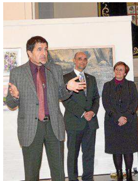
Todas las ediciones de la muestra pictórica han contado con e

No son los únicos, en la exposición de pintura se venden todos los años entre el 80 y el 90% de las obras, lo que añade más valor a la muestra si cabe. «El precio os-