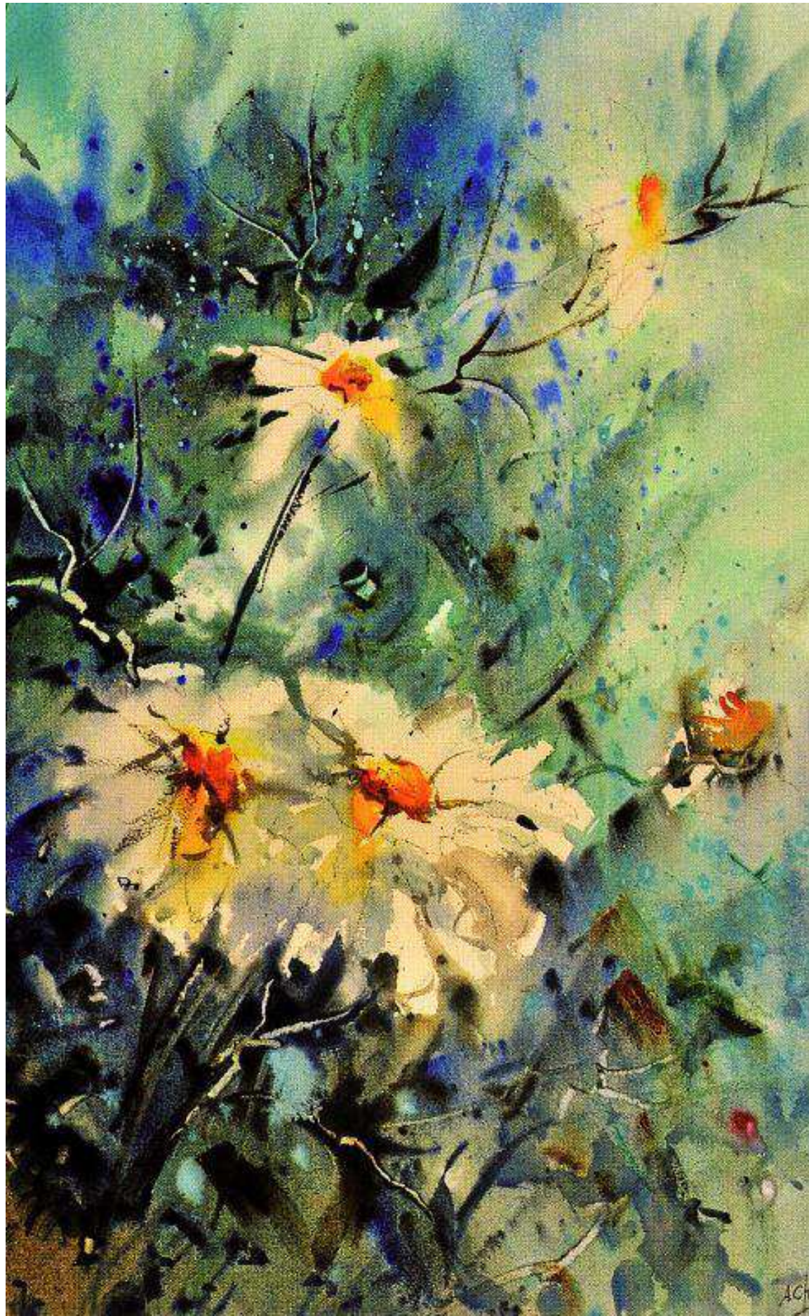
Reproducción de la acuarela 'Margaritas' de Aurora Charlo, que podrá disfrutarse en la exposición de Aspanoa.

XVI Exposición de pintura colectiva de Aspanoa Desde el próximo martes 15 de marzo hasta el día 25, un total de 107 obras de los pintores aragoneses de mayor renombre se mostrarán en el edificio Maristas del Gobierno de Aragón, ubicado en la plaza de San Pedro Nolasco