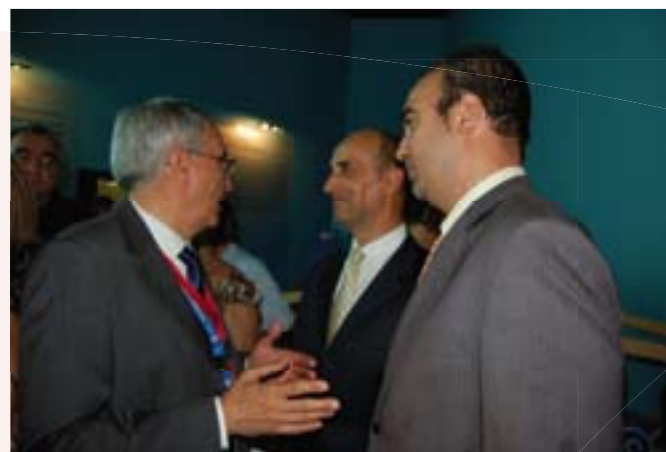
Pabellón de Hungría. Día 24 de agosto.